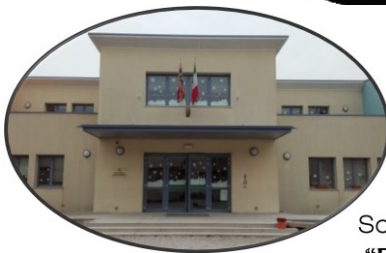
Scuola Primaria "D. Alighieri" Ormelle