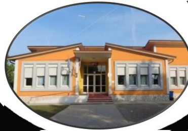
Scuola Primaria "G. B. Lovadina" Cimadolmo