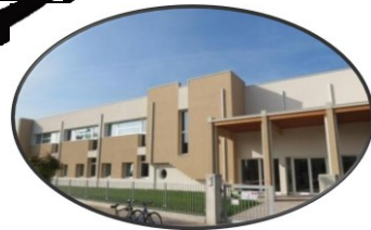
Scuola Secondaria di Cimadolmo