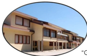
Scuola Secondaria "Giovanni XXIII" Ormelle